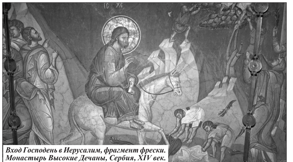
Вход Господень в Иерусалим, фрагмент фрески. Монастырь Высокие Дечаны, Сербия, XIV век.