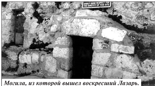
Могила, из которой вышел воскресший Лазарь.