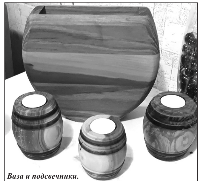
Ваза и подсвечники.