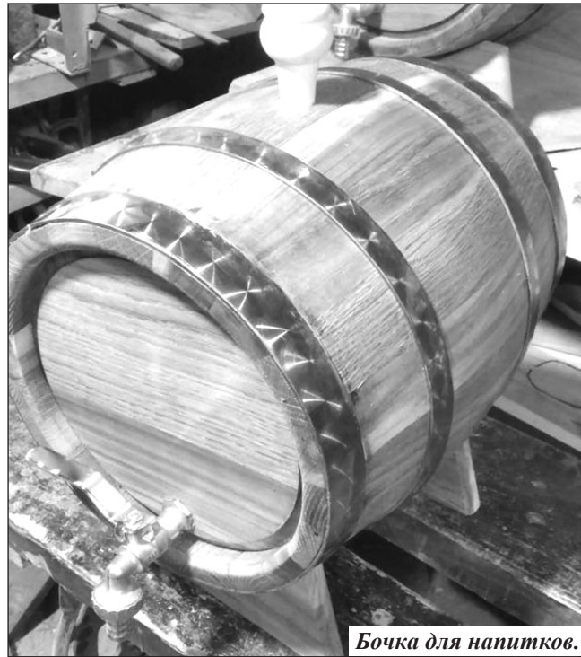
Бочка для напитков.

Важным в бондарном деле является использование той или иной древесины. Учитывается влажность дерева, сезон заготовки и прочие условия. Одной из самых ценных пород считается дуб, но я отдаю предпочтение ясеню, ольхе и другим. Каждая из них по-своему хороша. Ясень, к приме-